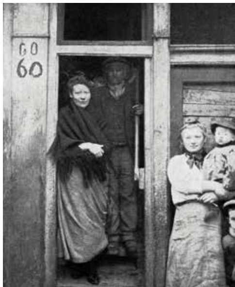
Wijde Gang, Willemsstraat vnl: nr. 58 en 60.